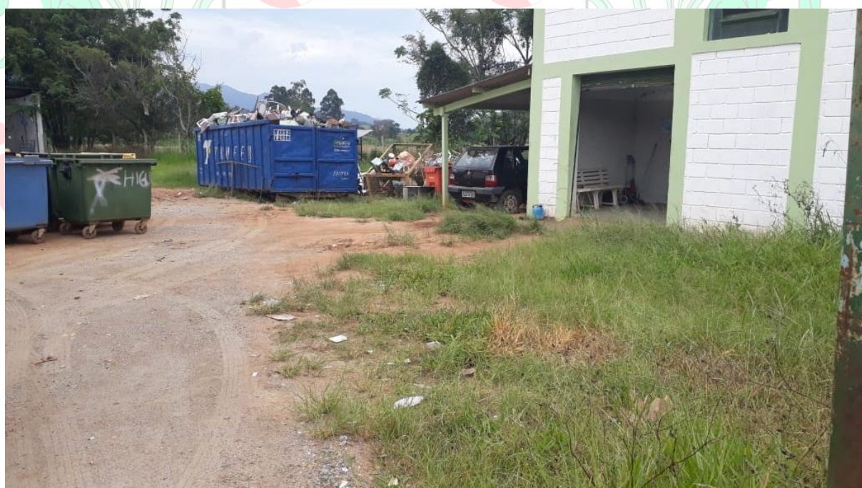
Figura 04: Piso