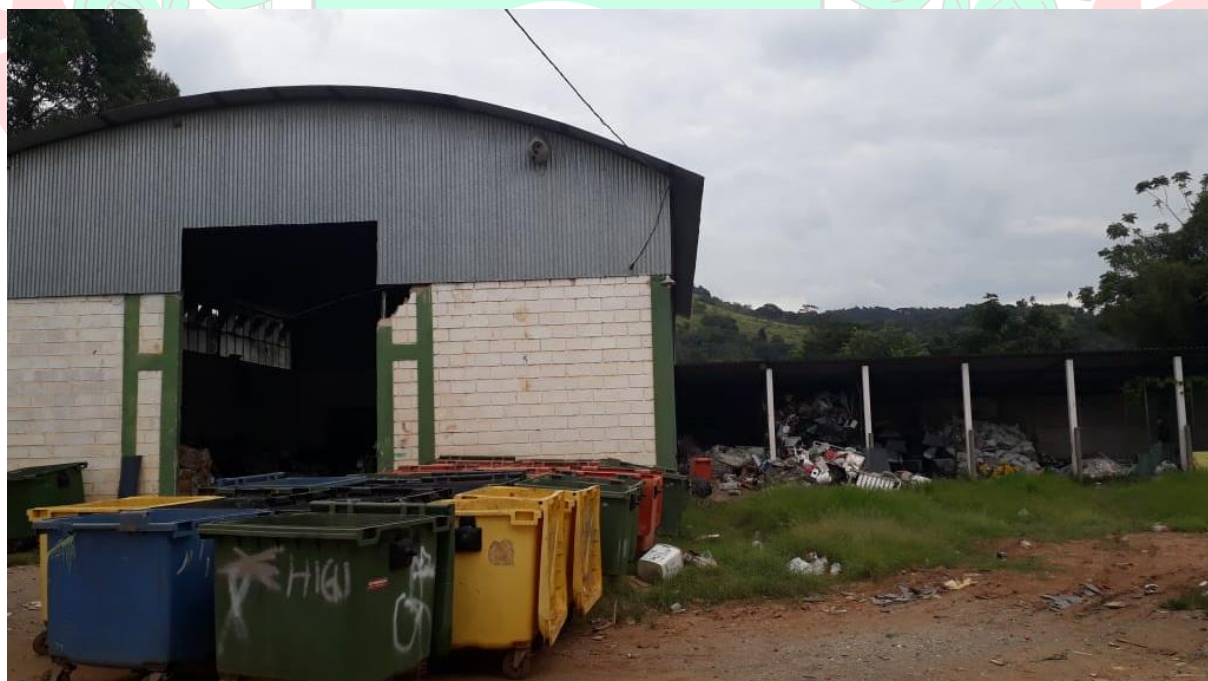
Figura 02: Galpão Existente