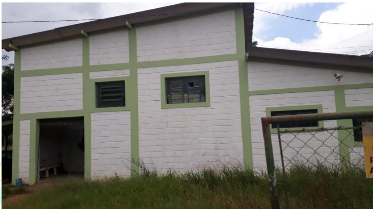
Figura 03: Prédio Existente