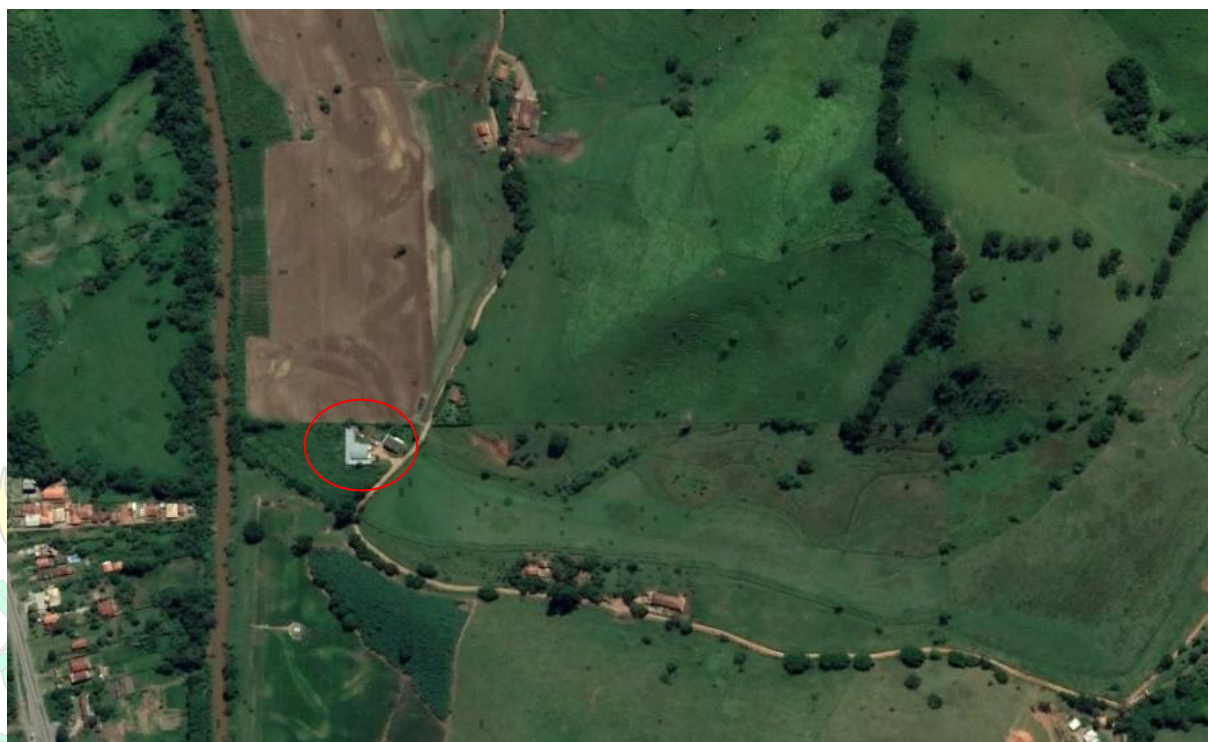
Figura 01: Google Earth, Estrada Municipal Joaquim da Costa Manso– Bairro Fervura. Em vermelho: trechos de intervenção.