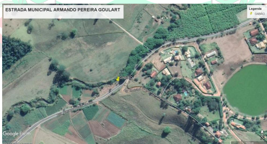
Figura 1 - Localização Estimada da área de intervenção indicada pelo marcador amarelo.

Localização aproximada em UTM: Zona: 23K / Latitude: 7488829.00 m S / Longitude: 421404.00 m E