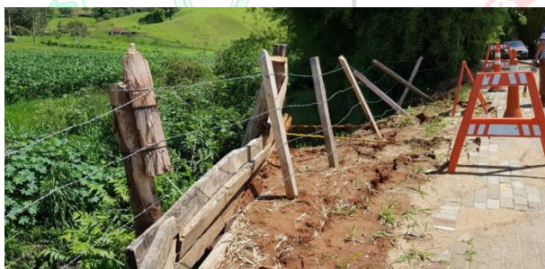
Figura 3 - Vista de montante