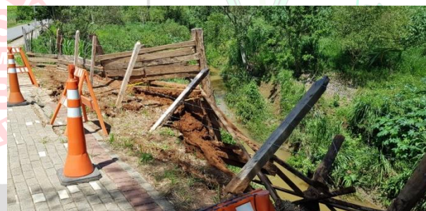
Figura 4 - Vista de jusante