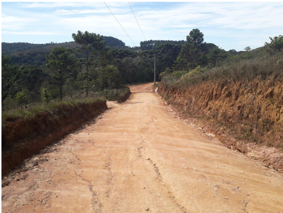
Figura 06: Trecho 01. Nesta imagem fica nitido as erosões causadas no meio da estrada.