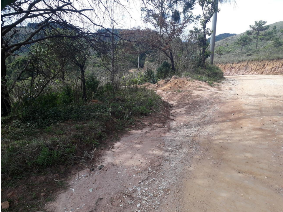
Figura 07: Trecho 02: