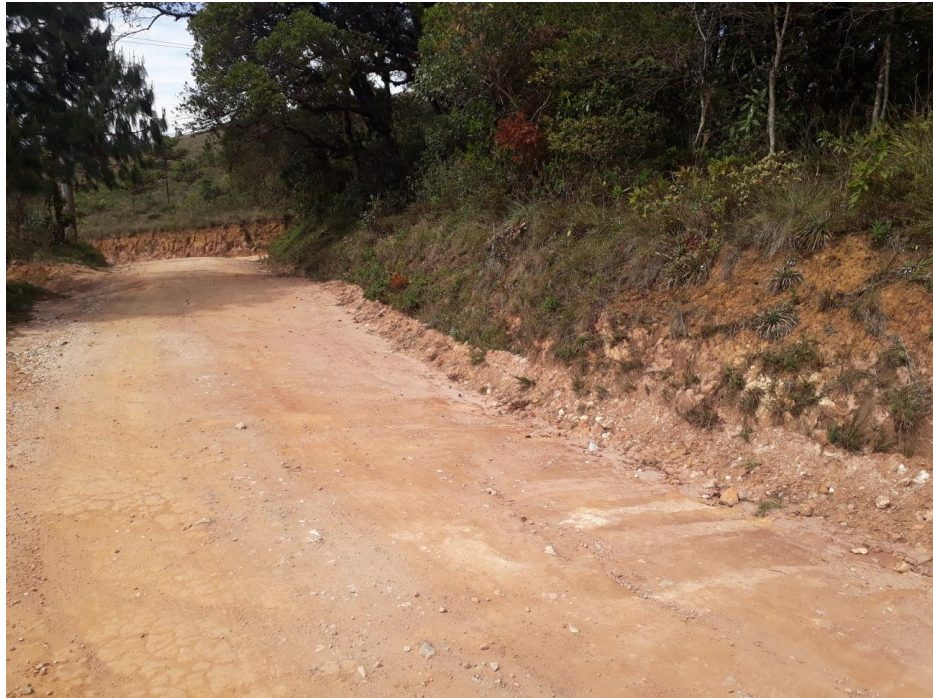
Figura 08: trecho 02.