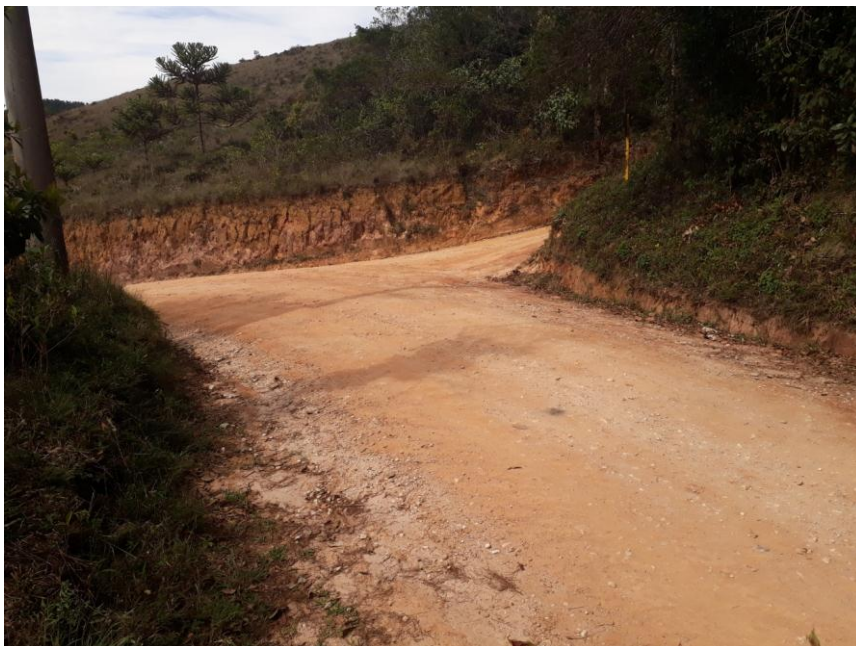
Figura 04: Trecho 01.