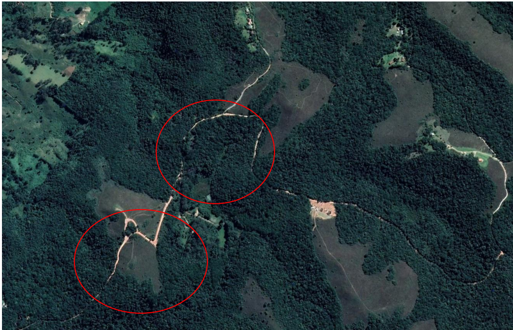
Figura 03: Google Earth, Estrada Municipal do Bauzinho – Bairro Paiol Grande. Em vermelho: trechos de intervenção.