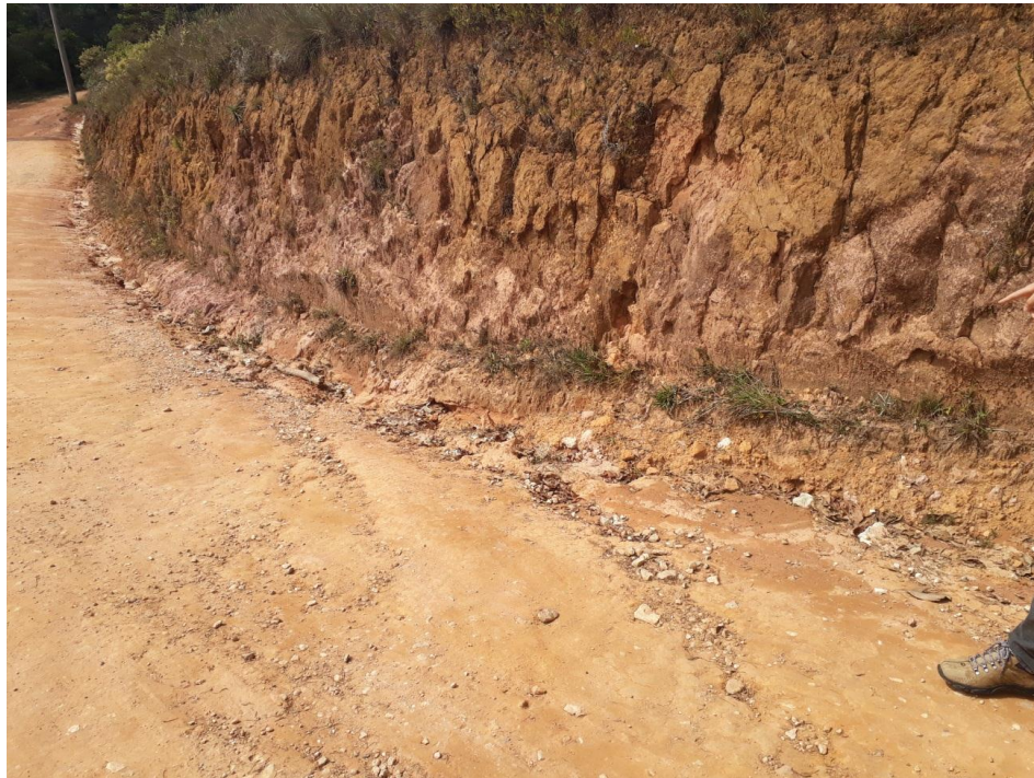
Figura 05: Trecho 01